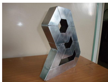
ヘキサゴン(六角形)