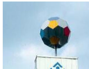
殺風景な鉄工所を彩る カラフル・サッカーボール