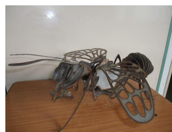
ただの蜂じゃないよ。ミツバチ！