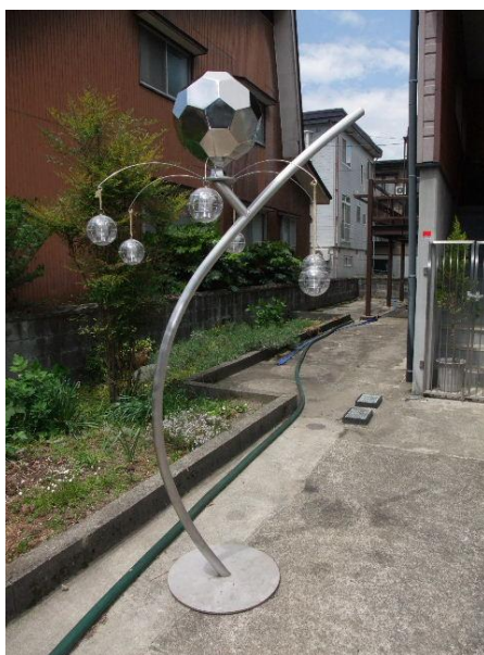
夜になると光を放つ 「希望の蛍」をあしらった スタンド