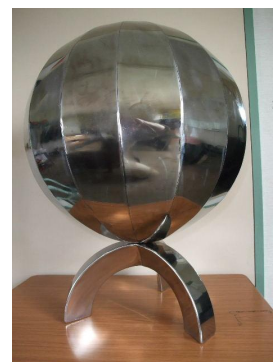
メルカトル図法による地球儀風